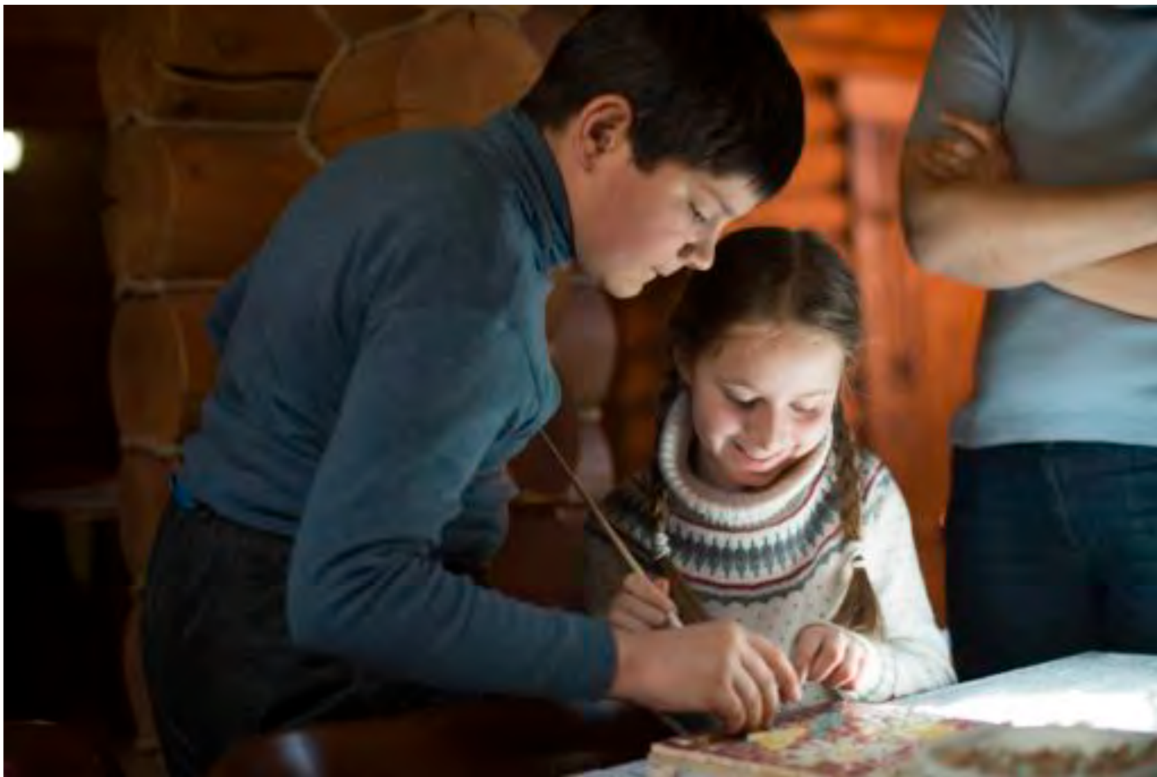
Взаимодействие в работе, помощь другому ребенку