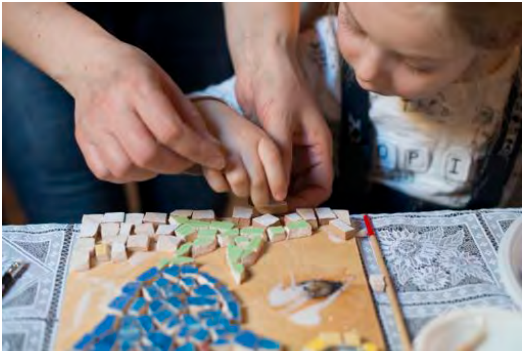
Взаимодействие в работе, помощь другому ребенку