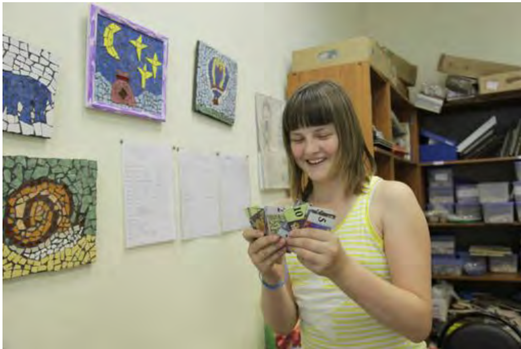
Система поощрений: Получаем фунтики