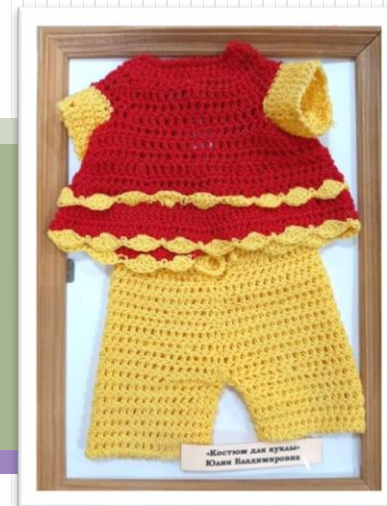
«Костюм для куклы» Анастасия Суфияновна